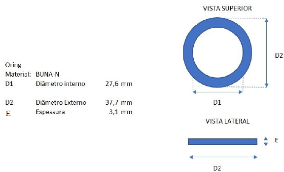
FIGURA 01 - DIMENSÕES DO ANEL DE VEDAÇÃO

3.4. Abaixo o aspecto da anel/arruela de vedação a ser fornecido.