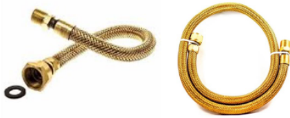
3.15.2. Imagem ilustrativa 05 – Tubo flexível metálico